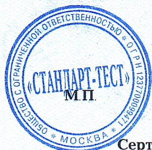
Схема сертификации: 3.